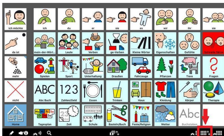
iPad mit Kommunikations-App „MetaTalk“