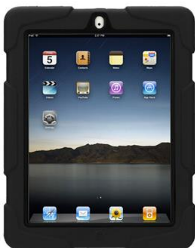
iPad mit Outdoor-Schutzhülle

Die iPads werden leihweise an die Nutzerinnen und Nutzer abgegeben und sind mit einer robusten Schutzhülle, die für den militärischen Gebrauch entwickelt wurde, geschützt. Die Outdoor Schutzhülle bietet allerhöchste Sicherheit in wirklich jeder Lebenslage - auch für Menschen mit Beeinträchtigung.